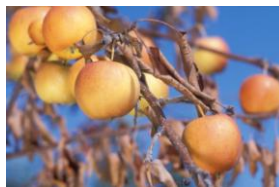
Feu bactérien sur pommier

Vincent PESTRE - 22 mars 2012 – Réunion du comité consommateur Aprifel