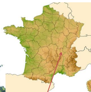
Monts du Lyonnais

Vincent PESTRE - 22 mars 2012 – Réunion du comité consommateur Aprifel