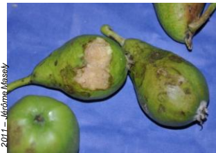
Dégâts de grêle sur poires

Vincent PESTRE - 22 mars 2012 – Réunion du comité consommateur Aprifel