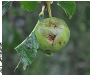
Dégâts de grêle sur pommes