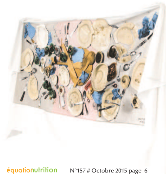
Exposition La 4 e Dimension Speer/Calerie Fréchet/Attitude

En conclusion, de nombreuses mesures sont déjà mises en place pour réduire le gaspillage alimentaire, compte tenu de l'attention accordée aux fruits et légumes, à tous les stades de la filière. Si le gaspillage comporte aussi une forte dimension morale et personnelle, les marges de manœuvre passent par une meilleure valeur attribuée aux produits comme aux métiers de la filière. Car ce qui a de la valeur ne se gaspille pas...ou moins !