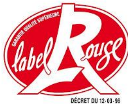
Reine Claude Label Rouge